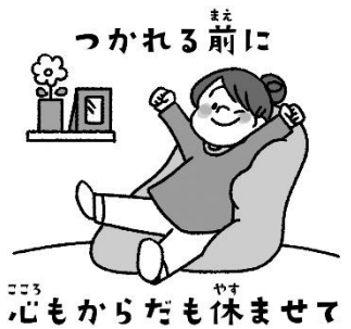
つかれる前に 心もからだも休ませて

しんねんど はじ げつ た せんせい ともだち べんきょう あたら 新年度が始まり、1 かが月が経ちました。先生や友達や勉強など、新し いことが多い 4月は知らないうちに ころから つか いることがあります。時にはゆっくり やすむ ことも大切です。休みの間は、 せいかつ 生活のリズムに気を付けながら、リフレッシュしましょう。