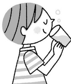
きおん たか 気温が高いときは のどがかわく 前に水分補給を