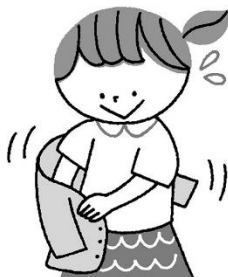
ぬぎ ぎ 脱ぎ着のしやすい 服装で、 たいかんおんど ちようせつ 体感温度を調節しましょう

あつ ひが 増えて きました、ねっちゅうしょう にならないように 注意して 生活 しましょう。