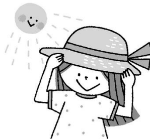
がいしゆつ 外出するときは ぼうし や ひがさ 紫外線をさけましょう