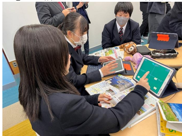
2年 社会科 日本の諸地域 Pages を活用した、デジタルブック作成