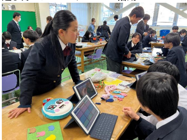
3年 家庭科 幼児との関わり方の工夫 Keynote や iMovie を活用した、おもちゃと遊び方のプレゼンテーション活動