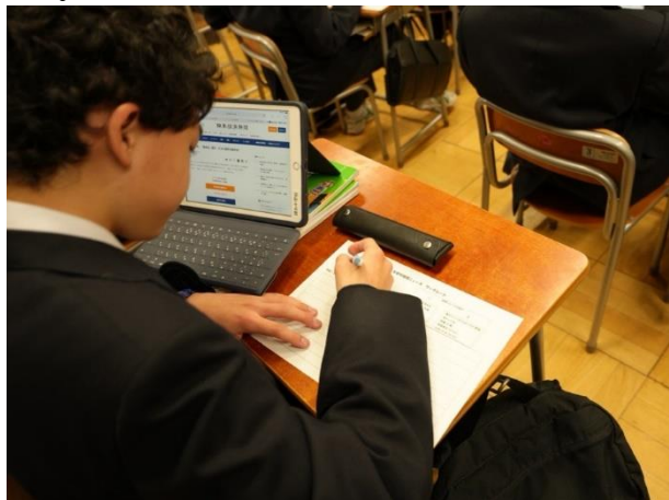
1年 社会科 地理ニュースを作ろう Keynote を活用した、まとめ動画の作成