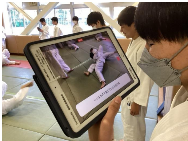
2年 保健体育科 武道(柔道) 独自技をカメラで撮影、身体感覚の知識化