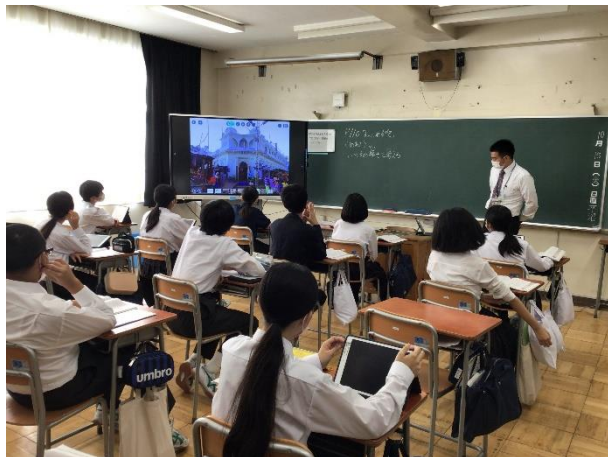
1年 特別の教科 道徳 「デジタル教科書」を活用した指導