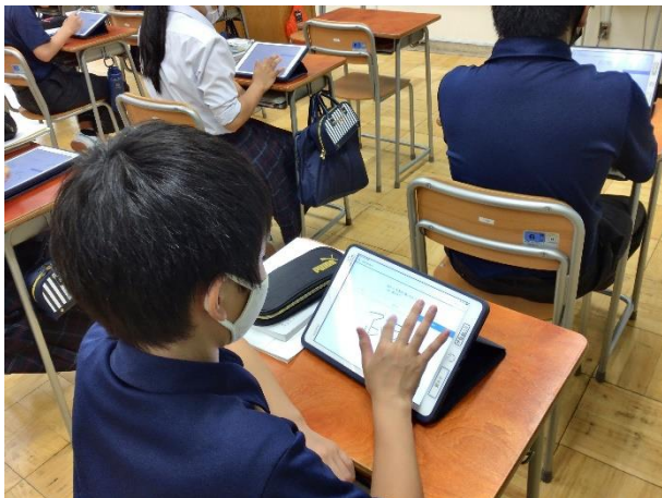
1年 国語科 「Monoxer」を活用した漢字の指導