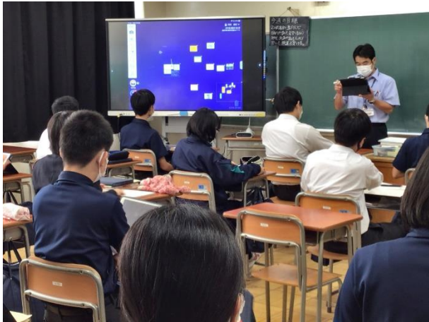
2年 国語科 「ロイロノート」のシンキングルールを活用した指導