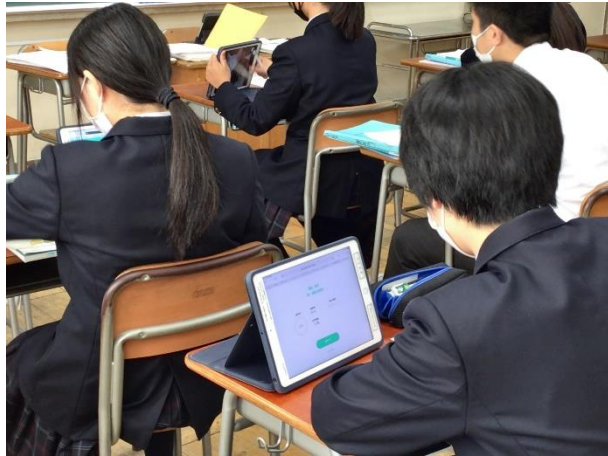
2年 数学科 個別最適化された AI 学習教材「Qubena」を活用した指導