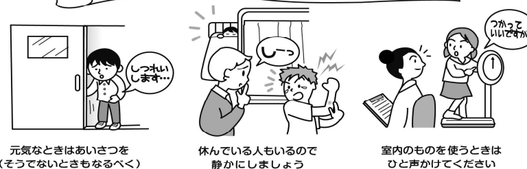
元気なときはあいさつを（そうでないときもなるべく）