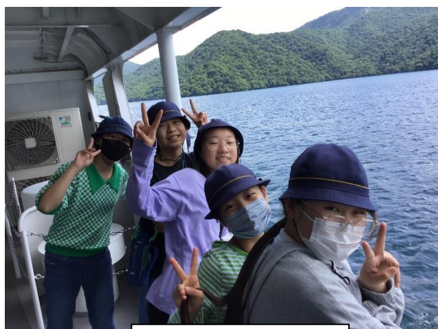
中禅寺湖クルージング