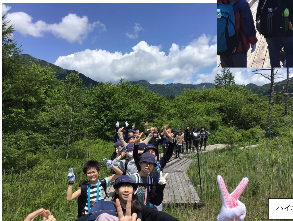
ハイキング(戦場ヶ原)