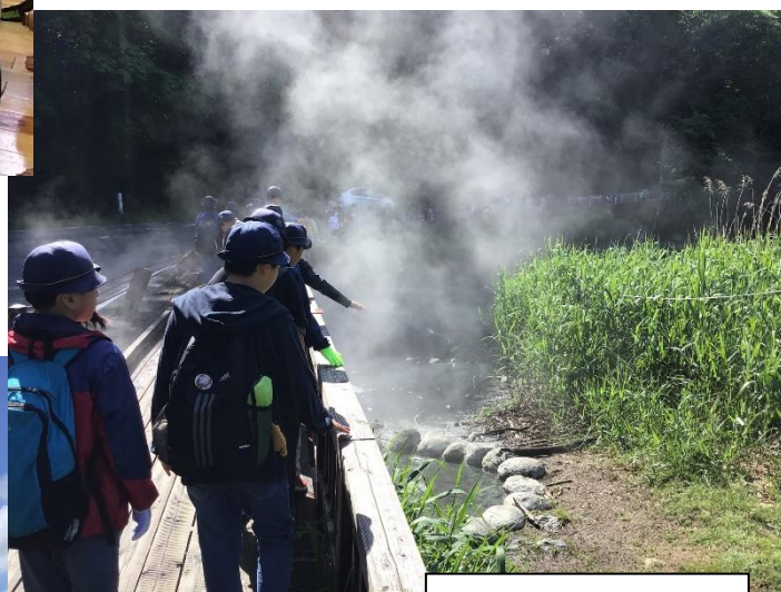
ハイキング(湯ノ湖)