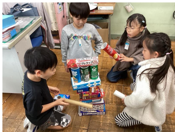
算数 「かたちあそび」 いろいろな筒や箱の形を高く積んでみよう。