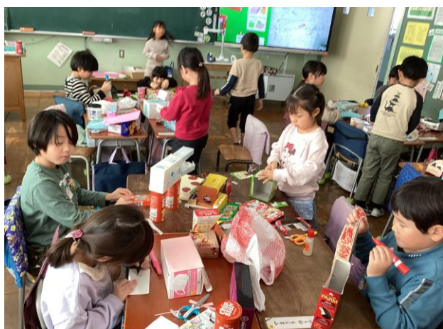
図工 「はことはこをくみあわせ」 集めた箱を組み合わせて、好きなものを作ろう。