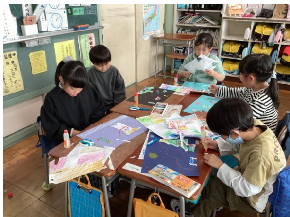
図工 「こすりだしから うまれたよ」 こすりだした紙を切り貼りして、絵を作ろう。