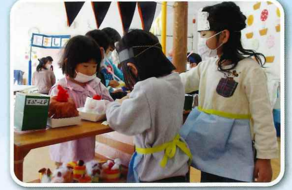
「次は誰がお店の人になる?」