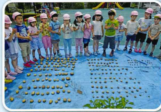
ジャガイモ収穫「すごい! 240個!!」