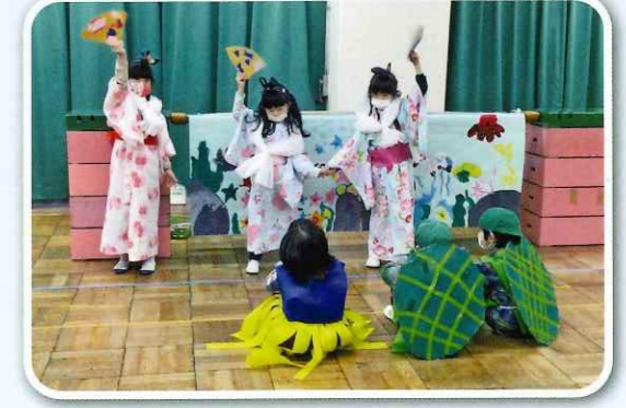
「私たちの踊り、すてきでしょ」