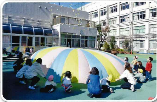
親子でのふれあい活動