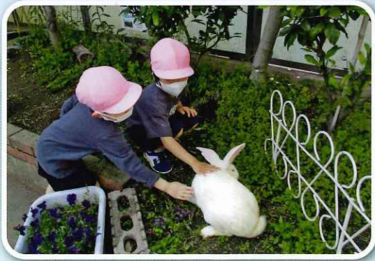
「うさぎさん、かわいいね」

自然に触れて感動する体験を通して、好奇心や探究心、命を大切にする気持ちを育みます。