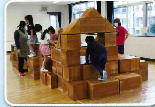
「みんなのお家が完成!」