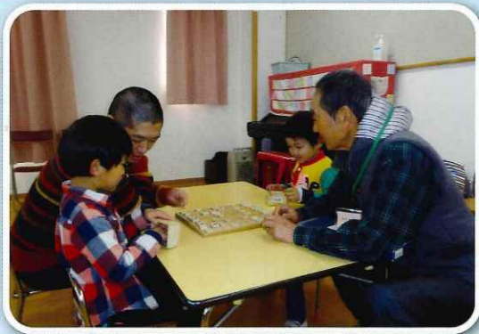
ふれあい会「おじいちゃんと勝負!」