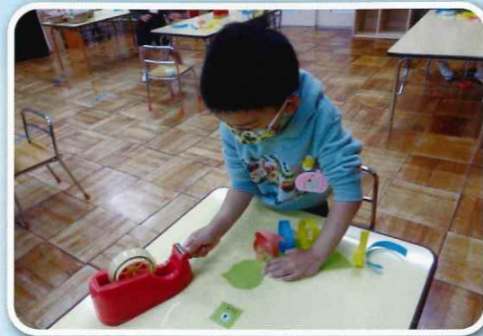
「すてきな鳥をつくろう」