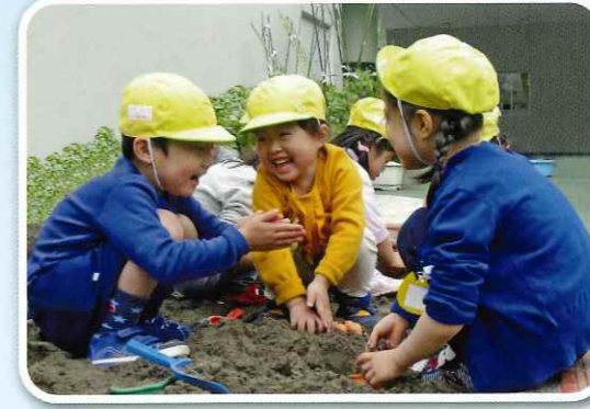
「楽しいね」「面白いね」