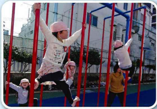
「絶対ゴールするぞ!」