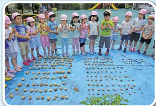
ジャガイモ収穫「すごい! 240個!!」