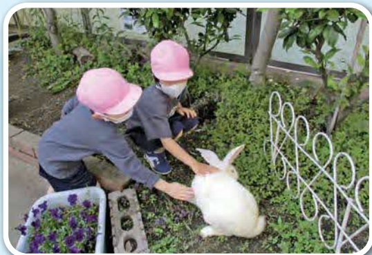
「うさぎさん、かわいいね」

自然に触れて感動する体験を通して、好奇心や探究心、命を大切にする気持ちを育みます。