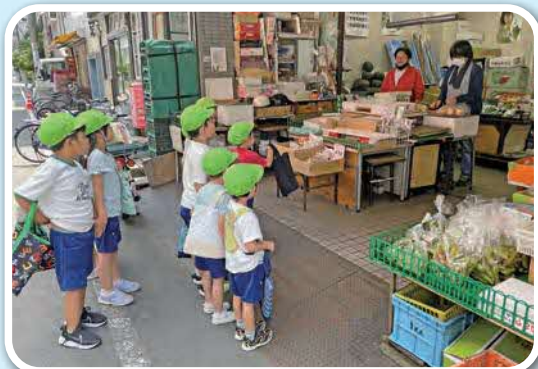
「近所のお店へお買い物」