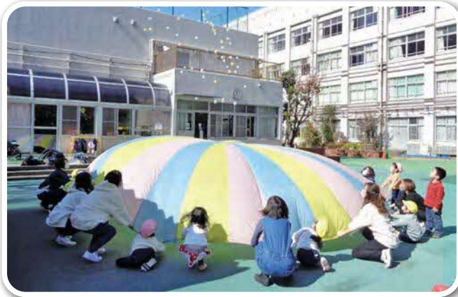
親子でのふれあい活動