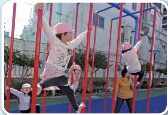
「絶対ゴールするぞ!」