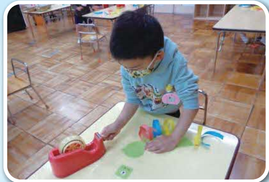
「すてきな鳥をつくろう」