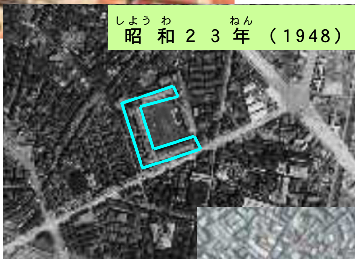
しょうわ ねん 昭和23年 (1948) ・ 74年前の写真