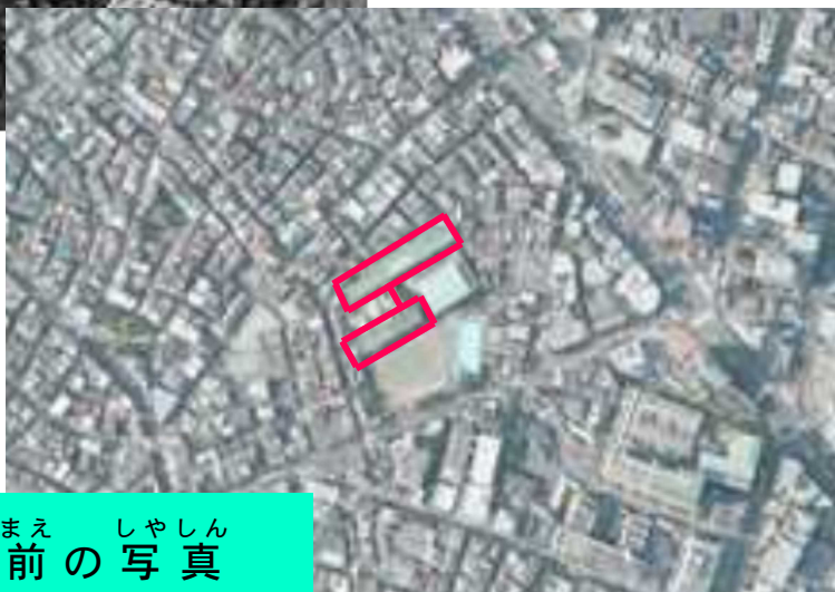
れいわ がんねん 令和元年 (2019) ・ 3年前の写真