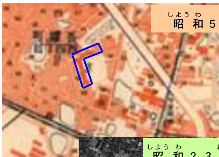
しょうわ ねん 昭和5年 (1930) ・ 92年前の地図