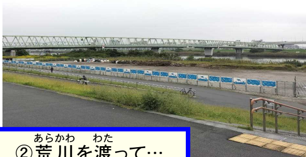
あらかわ わた ② 荒川を渡って…