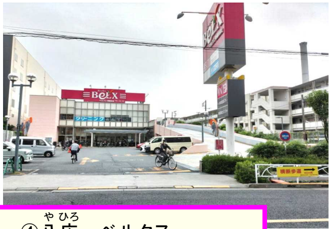
やひろ ④ 八広・ベルクス こうちようせんせい きゆうじつ い 校長先生も、休日にはよく行きます!