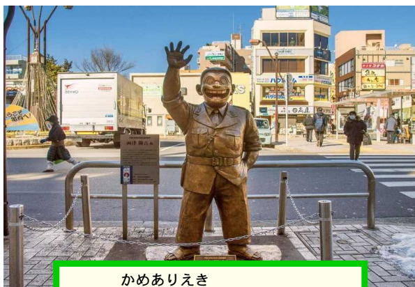
かめありえき ① 亀有駅をスタート

☆ 「中居堀」は「亀有駅」をスタートして、北十間川 (スカイツリー・オリンピックの前の川) まで流れていた。