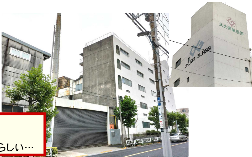
おおく ぼせいびん ⑤ 大久保製薬 つく リポビタンDのビンを作っているらしい…